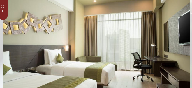
LIVING PLAZA JABABEKA